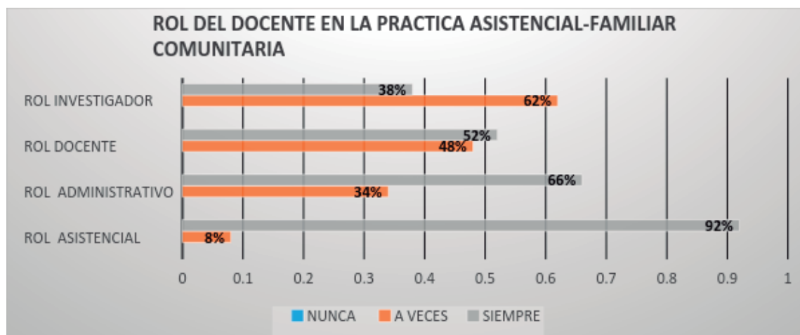
Grafico 2. El rol docente en la práctica asistencial familiar comunitaria Lima-Norte Perú 2016.

descriptivas e inferencial como frecuencias, proporciones y la estimación puntual por Intervalos de Confianza del 95%. El presente estudio fue aprobado por el comité de ética de la Universidad Cesar Vallejo.